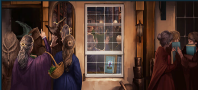
Fleury & Bott

Fleury et Bott ( Angl. Flourish and Blotts ) est le nom d'une boutique située dans la partie nord du Chemin de Traverse, à Londres. Elle se spécialise dans la vente de livres.