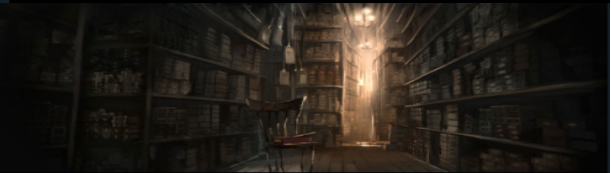
Ollivander - Fabricants de baguettes magiques